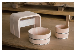
一枚の檜板を曲げた風呂椅子。湯桶・手桶は軽さを生かした木曾のさわら。

野々市市白山町1-14 ☎(076)248-4668 営/10:00~19:00 休/木曜 P/25台 http://www.decot-takematsu.jp information ■ハグみじゅうたんやオリジナル一枚板テーブルなども取り扱っております。お気軽にご相談下さい。