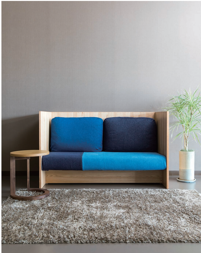
「間合01 sofa 1500」W1500×D750×H900 (SH360)。レッドオーク、ウレタン塗装。210,000円(税別)。

上質な大人のインテリアを提案する『タケマツ家具』では、日本を代表する家具デザイナー小泉誠氏をフィーチャーしたフロアが人気を集めている。府中家具メーカー『若葉家具』×小泉誠のブランド「kitoki」をはじめ、生活道具（by 小泉誠）が豊富に揃い、小泉氏自身が監修した小屋風のディスプレイは眺めているだけでも楽しい。中でも注目は、メイドインジャパンの備後デニムを使用した『間合