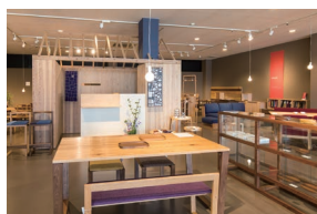
「kitoki」をはじめ、素材、つくり、デザインにこだわったアイテムが並ぶ。